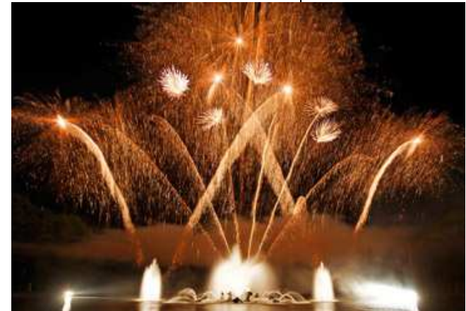
Grandes eaux nocturnes de Versailles