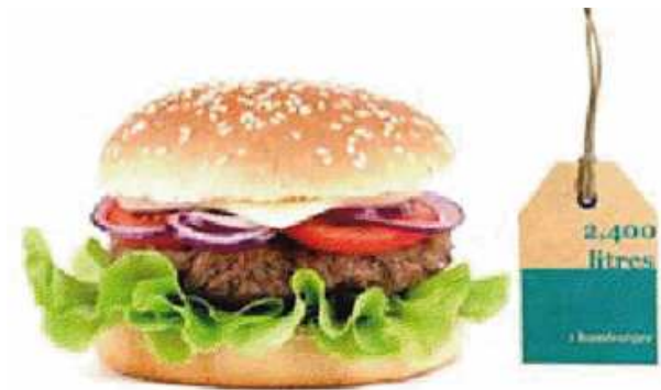
Empreinte eau d'un hamburger