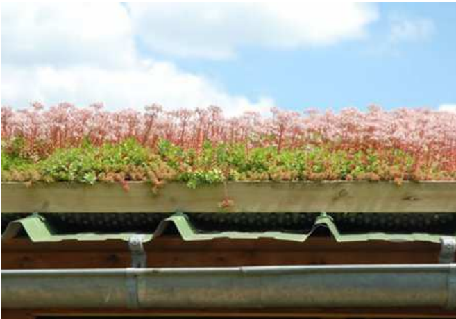
Toiture végétalisée à la Ferme de Paris

4. Vers une ville plus perméable : intercepter les eaux de pluie pour protéger le milieu naturel