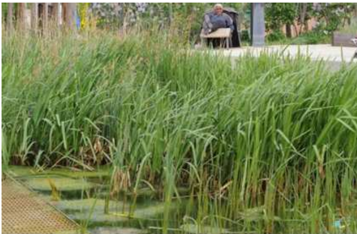
Bassin central parc Serge Gainsbourg

OPE « être une ville exemplaire utilisant l'ENP pour s'embellir et se rafraîchir »